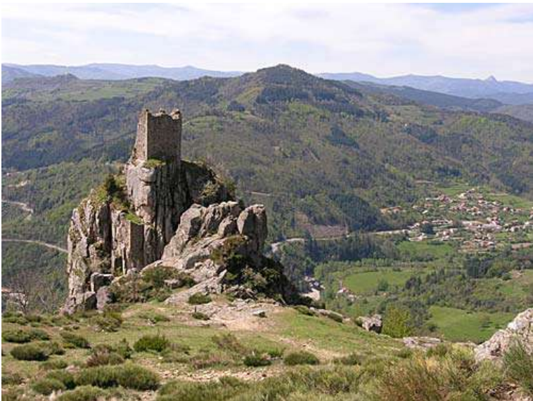
Vestige de Roche Bonne (tour de guet ou donjon du XI ou XII ème siècle), au fond la chaîne des sucs et en bas la vallée de l'Eyrieux. (entre le Cheylard et St Martin de Valamas)