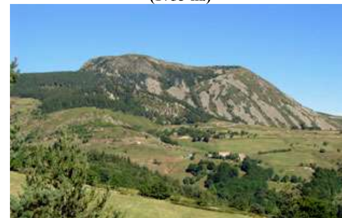
Mont Mézenc, plus haut sommet d'Ardèche. (1753 m.)