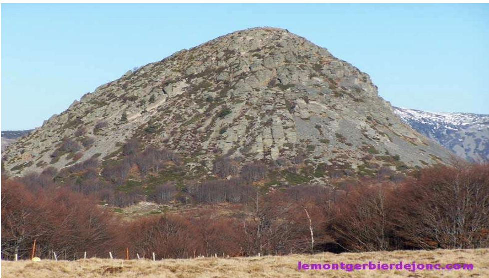
Le Mont Gerbier de Jonc, source de la Loire.