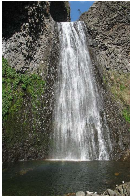
Cascade de Ray-Pic, 60m. de hauteur. Situé entre Burzet et Lachamp Raphaël.