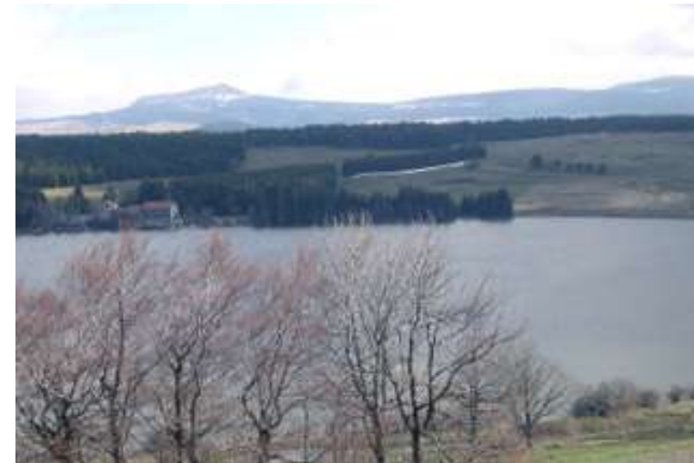
Lac de St Front (ancien cratère volcanique).